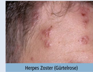
Herpes Zoster (Gürtelrose)

Die Gürtelrose (Herpes Zoster) tritt meist einseitig, gürtel- oder sektorenartig im Versorgungsgebiet von Hautnerven auf. Verbunden damit ist meist ein stechender oder beißender Schmerz. Während Herpes simplex in der Frühphase - also noch vor dem Auftreten von Bläschen - mit Aciclovirhaltigen Cremes behandelt werden kann, muss die Gürtelrose immer durch einen Arzt behandelt werden. Neben einer desinfizierenden Lokaltherapie und Tabletten müssen manchmal Infusionsbehandlungen eingesetzt werden, zur Virenbekämpfung.