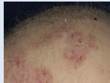
Aktinische Keratosen (AK)

Das maligne Melanom (MM) gehört zu den bösartigsten Krebsarten überhaupt. Ein Teil der MMs geht aus Leberflecken hervor, so dass eine Ähnlichkeit gerade im Anfangsstadium häufig ist. Das MM kommt bei Transplantierten nur geringgradig häufiger vor, als bei Nicht-Transplantierten. Trotzdem sollten große (>5 mm), ungleichmäßig gefärbte, unregelmäßig begrenzte, asymmetrische oder gar blutende Muttermale kontrolliert werden. Gleiches gilt für wachsende oder neu aufgetretene, dunkel pigmentierte Flecken auf der Haut.