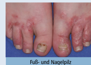
Fuß- und Nagelpilz

Die Pityriasis versicolor ist eine ungefährliche, aber gelegentlich juckende Erkrankung, die durch bestimmte Hefepilze verursacht wird. Besonders an Körperstamm, Oberarmen und Hals finden sich hellbräunliche Flecken, die bei sonnengebräunter Haut auch weißlich erscheinen können. Eine Behandlung mit entsprechenden Shampoos und Lotionen ist hier angezeigt.