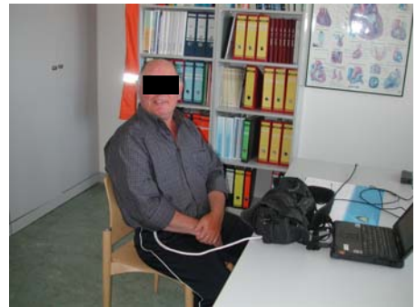
Incor-System zur Unterstützung des linken Herzens (elektrisch betrieben)