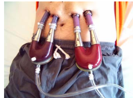
Excor-System zur Unterstützung des linken und rechten Herzens (pneumatisch betrieben)

► Notfalltelefon: 0941-944 9830 (Intensivstation 97)