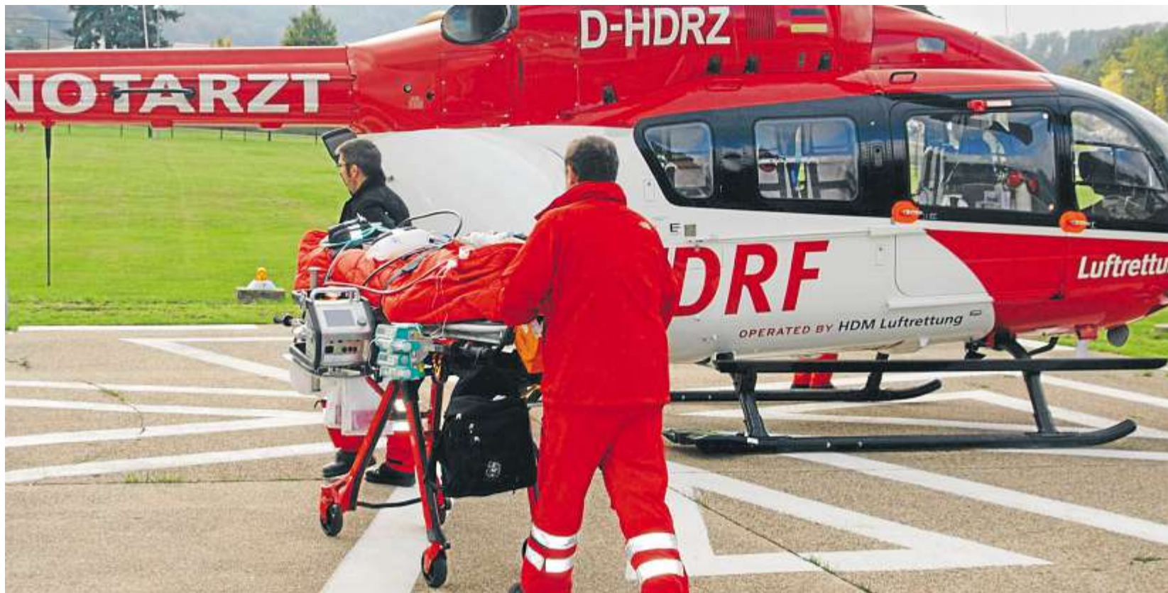
Die tragbare Herz-Lungen-Maschine – seitlich links an der Trage befestigt – ermöglicht es, Patienten mit akutem Organversagen in eine entsprechend ausgestattete Klinik zu verlegen.