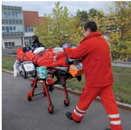
Abb. 1: Patiententransfer vom Landeplatz des Rettungshubschraubers zur übernehmenden Intensivstation des Universitätsklinikums Regensburg (UKR)

Das Transportteam rekrutiert sich aus einer interdisziplinären Arbeitsgruppe. Es besteht aus einem erfahrenen Kardioanästhesisten und Notfallmediziner, einem versierten Kardiotechniker und einem kardiochirurgischen Oberarzt [3, 4, 5]. Die Verfügbarkeit des Transportteams besteht 24 Stunden und 7 Tage die Woche. Die Aktivierungszeit beträgt in der regulären Arbeitszeit weniger als 10 Minuten und außerhalb der regulären Arbeitszeit maximal eine Stunde. Als Transportmittel steht entweder der Rettungshubschrauber „Christoph Regensburg“ (Eurocopter EC 145) oder der Intensivtransportwagen „ITW Regensburg“ zur Verfügung. Das Transportteam ist so organisiert, dass alle notwendigen Utensilien, die