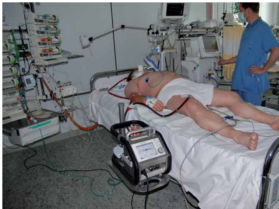
Abb. 2: Patient mit CARDIOHELP-System nach Verbringung auf die Intensivstation

Mit Aufnahme der extrakorporalen Unterstützung kam es bei allen Patienten un-